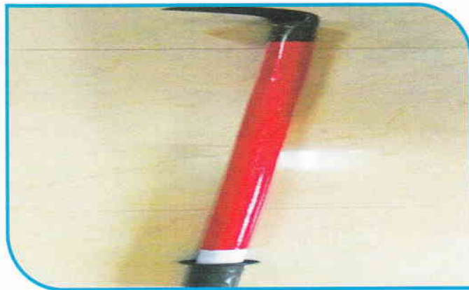
नवोन्मेष-चेक रेल की सफाई के लिए आद्रा मंडल के वरिष्ठ सेक्शन इंजीनियर (रेलपथ) / चाण्डिल द्वारा नया चेक रेल सफाई साधन बनाया गया।