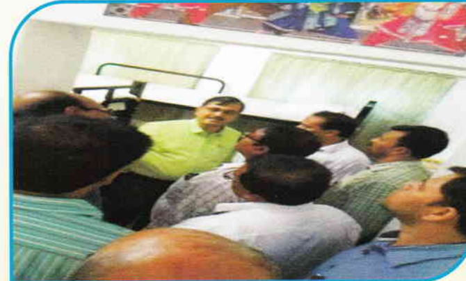
रात के समय चालकदल की उपलब्धता में सुधार के लिए दिनांक 25.07.18 को अनारा में चालकदल विश्रामकक्ष का उद्घाटन किया गया।