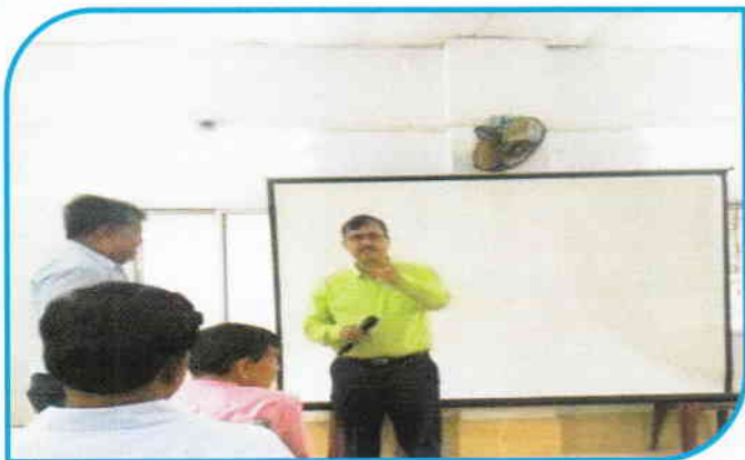
दिनांक 27.06.18 को रेलवे अधिकारी क्लब/ बोकारो में संरक्षा संगोष्ठी आयोजित की गई, जिसमें अधिकारियों के साथ पर्यवेक्षकों ने भाग लिया।